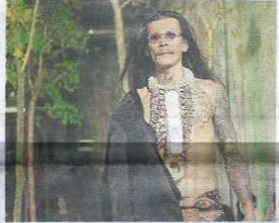
▲到青店的老板也來友情串場，捲起褲步來也有型有款，取得不少掌聲。